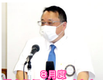
8月度 記念祝福がありました。